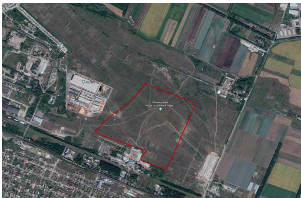
- межі території Вінницького індустріального парку

1.3 Розділ 4 «Місце розташування та розмір земельної ділянки» відображення викопіювання із матеріалів аерофотозйомки, викласти в наступній редакції: